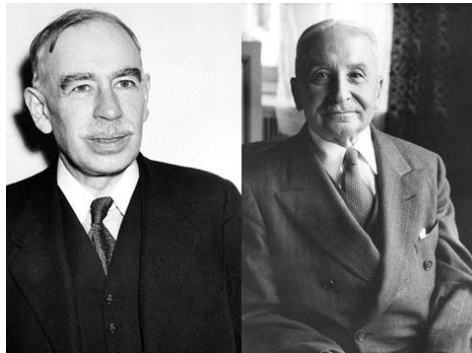
John Maynard Keynes (1883 – 1946)

Hayek folgt Mises in diesem Punkt nicht. Seine wissenschaftliche Methode lässt sich als radikaler Subjektivismus bezeichnen – und damit übt Hayek quasi den Schulterchluss mit der wissenschaftlichen Methode, die die Hauptstrom-Volkswirte vertreten. 2